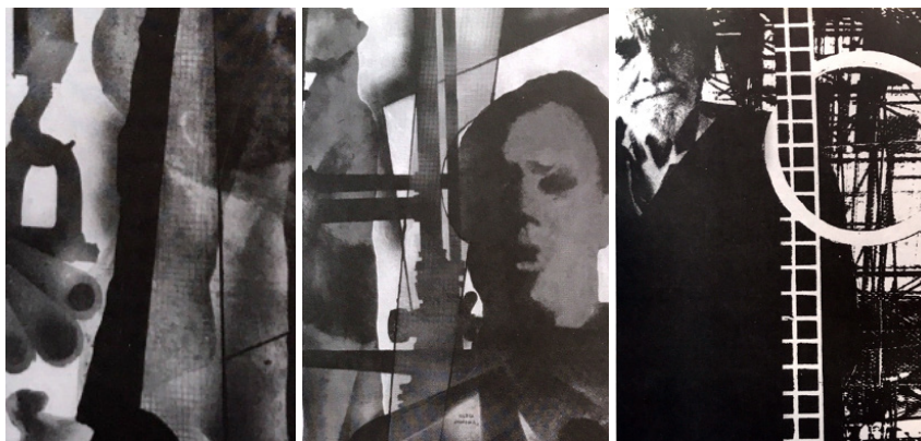
Figs. 3 a, b, c