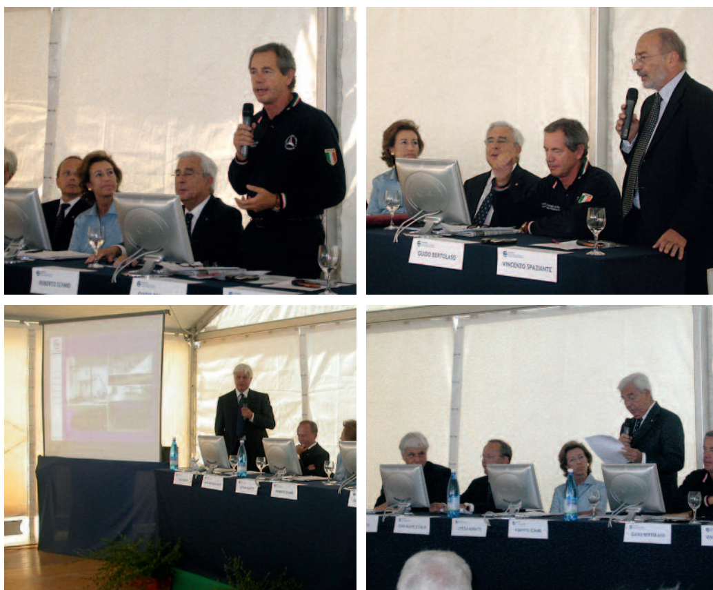
Figura 1 Alcuni interventi durante la cerimonia di inaugurazione di Eucentre, avvenuta il 5 settembre 2005: Guido Bertolaso (in alto a sinistra); Vincenzo Spaziante (in alto a destra); Enzo Boschi (in basso a sinistra) e Roberto Schmid (in basso a destra).

A Eucentre si inaugura un nuovo edificio con importanti attrezzature per video conferenze e comunicazione.