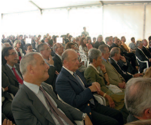
Figura 2 Una parte della platea presente alla cerimonia di inaugurazione di Eucentre (a sinistra) e l'intervento di Letizia Moratti, allora Ministro dell'Istruzione, Università e Ricerca (a destra)